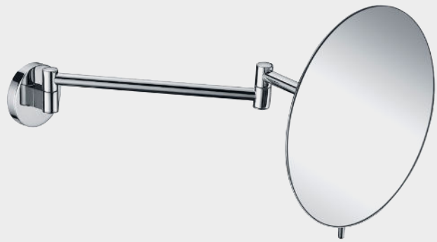
ESPEJO PARED ORIENTABLE