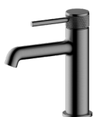
Gun metal 3553821300