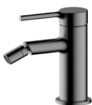
Gun metal 3553820500